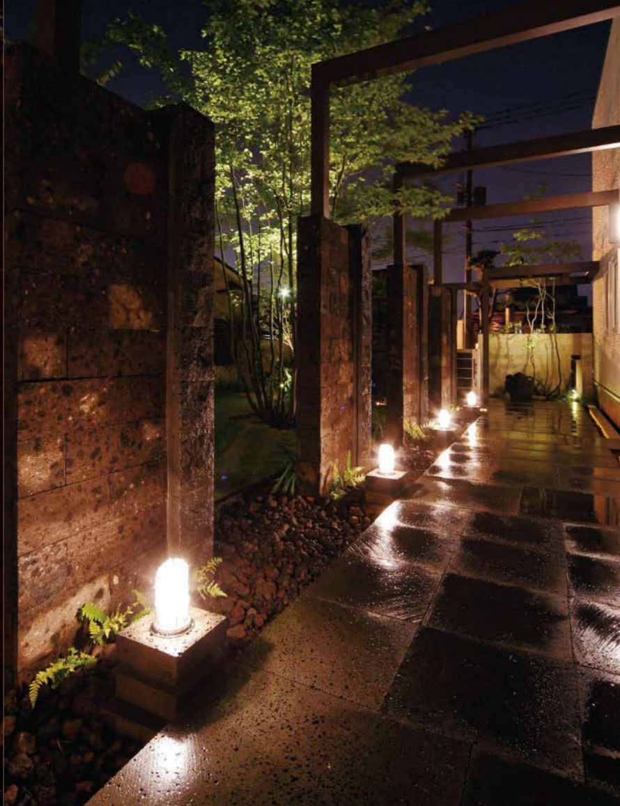
クロボカン / ボルケーノ (湿潤)